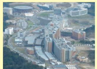
移転が進む伊都キャンパス

TEL:092-805-3677(平日9:00～17:00まで ※土・日・祝日は除く)