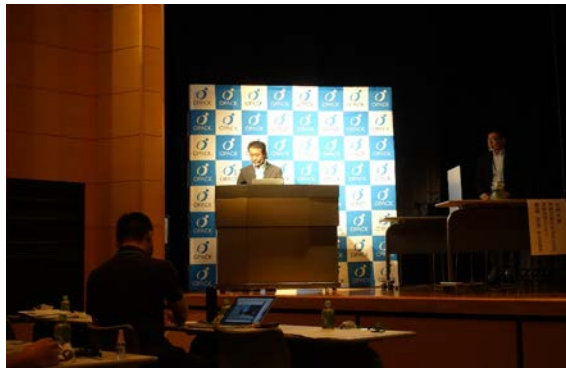
▲OPACK 刈茅事務局長の開会挨拶