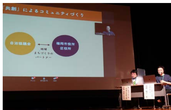
▲ふくおか共創プロジェクト 池田共創コネクターの 事例紹介 「ふくおか共創プロジェクト」